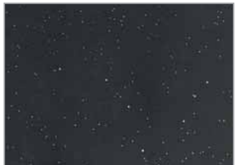
Carbón 2192 EP - 099 - PO