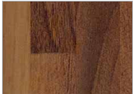
Nogal parquet EP - 096 - OP