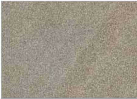
Kamala claro EP - 093 - IS