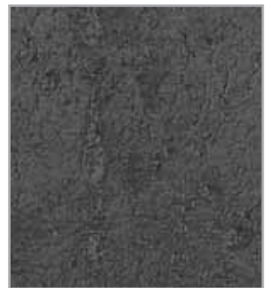
Cemento oscuro EP - 092 - IS