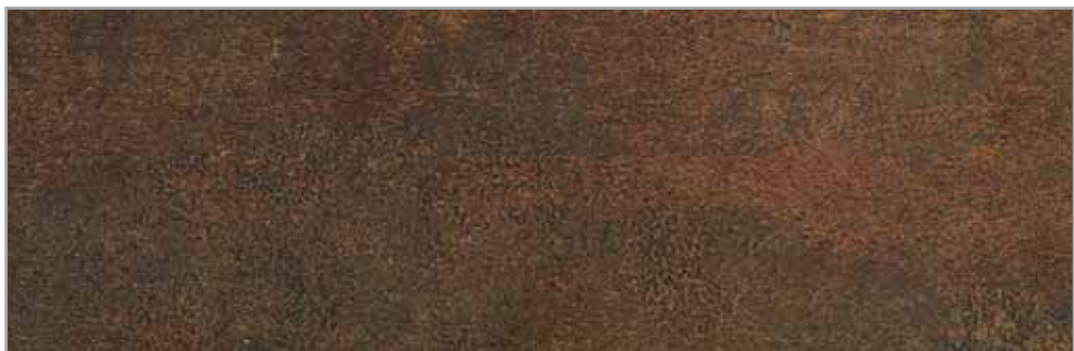
Fresko 51301 EP - 086 - IS