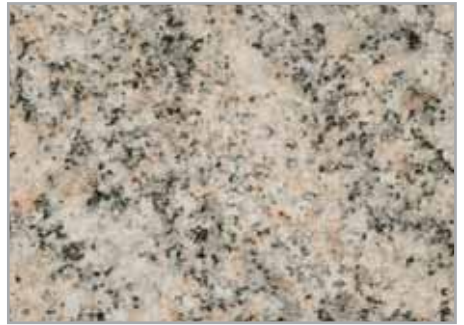
Turmalina claro EP - 094 - IS