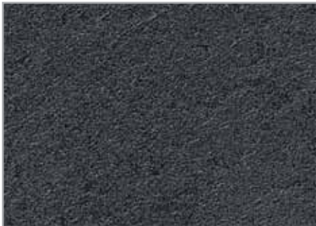
Mustang EP - 095 - IS