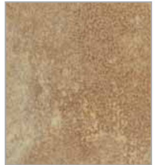
Fresko 51300 EP - 087 - IS