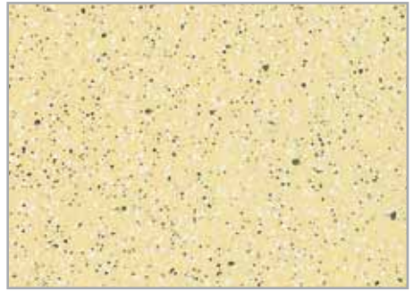
Lunar Beig EP - 022 - MT