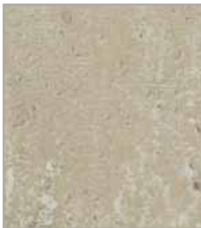
Cemento natural EP - 091 - IS