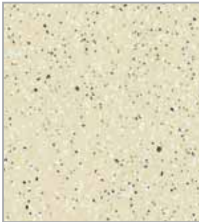
Lunar claro EP - 023 - MT