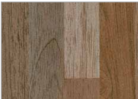
Davao oscuro EP - 097 - PL