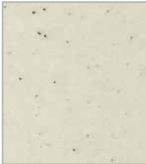
Mármol Micado EC/EP - 050 - MT